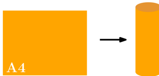
Рис. 2. Изготовление маяка

Маяки имеют высоту 210 мм и диаметр 40 мм, и изготавливаются из оранжевой бумаги формата А4. Лист бумаги сворачивается в цилиндр диаметром 40 мм (см. рис. 2), после чего утяжеляется снизу.