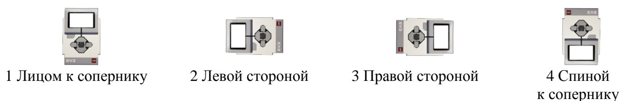
Рис. 1. Положение робота на ринге

5.1.4. По окончании расстановки оператор не имеет права более перемещать робота.